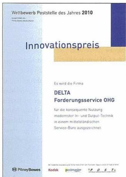
Innovationspreis im Wettbewerb „Poststelle des Jahres“ für effiziente und komplexe Postbearbeitung

In einer Branche, in der nur geringe Margen erzielt werden und die Konkurrenz ausländische Callcenter einsetzt, kann ein externer Dienstleister am Produktionsstandort Deutschland nur durch Einsatz modernster Technologien erfolgreich sein. In der Finanzdienstleistungsbranche heißt das: Informations- und Dokumentenlogistik müssen optimal organisiert werden. Viele der am Markt angebotenen Dokumentenmanagement-Systeme lösen spezielle Aufgaben. Oft muss sich die Organisation dem eingesetzten Werkzeug anpassen. Ein Finanzdienstleister muss jedoch flexibel auf die Anforderungen seiner Kunden reagieren. DELTA entwickelte aus diesem Grund mit x.tend 3 ein flexibles Werkzeug. Dabei unterscheidet der ganzheitliche Ansatz von x.tend 3 beispielsweise nicht mehr zwischen Massen- und Individualkorrespondenz und erfasst schriftliche Korrespondenz insgesamt; egal wie und an welcher Stelle Informationen entstehen.